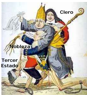
El Tercer Estado oprimido por los privilegiados