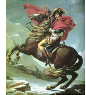
Napoleón como general victorioso