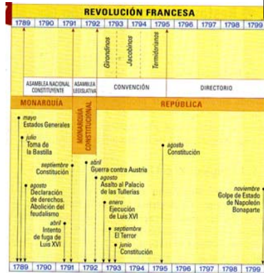
Eje cronológico de la Revolución Francesa (1789-1799)