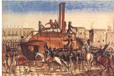
Ejecución de Luis XVI en la guillotina